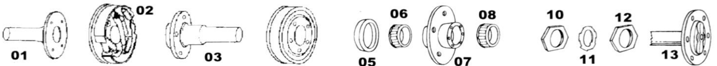
01: Cañonera - 02: Plato de Freno - 03: Puntera - 04: Campana de Freno - 05: Retén de grasa - 06: Rulemán - 07: Maza 08: Rulemán - 10: Tuerca - 11: Seguro - 12: Tuerca - 13: Paliers